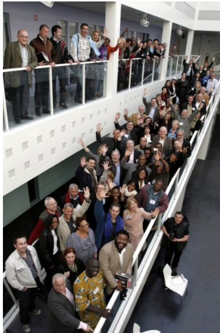
Les congressistes de l'UCPF à l'IJBA, l'école de journalisme de Bordeaux.